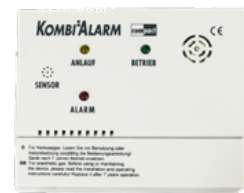
Kombisensor Narkose-/ gasmelder

Die Scharfschalt-LED zeigt Ihnen jederzeit den Schaltzustand der Anlage an. Somit wissen Sie, ob die Anlage scharf oder unscharf geschaltet ist.